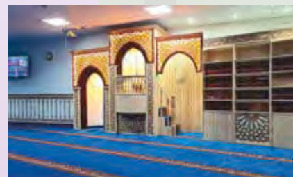
Gebetsraum der Abu Bakr Moschee

Christ:innen gehen sonntags in den Gottesdienst. Die meisten wissen, wie das läuft. Muslime gehen am Freitag Mittag zum Freitagsgebet. Was genau machen sie da?